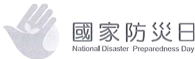
圖 1、國家防災日 LOGO (名稱：青鳥)

國家防災日 LOGO 係去(108)年辦理「921 震災 20 週年暨莫拉克風災 10 週年」系列活動時，由行政院(以下簡稱本院)與教育部合作，向國內設計相關學院或對設計有興趣之在校學生徵件，徵選結果由特優獎「青鳥」作為往後國家防災日 LOGO (詳圖 1)。請各機關(單位)於辦理國家防災日相關活動時，將此 LOGO 廣為運用於各式活動場布及文宣設計上，以達到形象識別之效果(圖檔可至「中央災害防救會報」網站下載)。